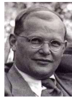
D. Bonhoeffer: 1906-1945

Die leibliche Gegenwart anderer Christen ist dem Gläubigen eine Quelle unvergleichlicher Freude und Stärkung. (...) Darum, wer bis zur Stunde ein gemeinsams Leben mit anderen Christen führen darf, der preise Gottes Gnade aus tiefstem Herzen, der danke Gott auf Knien und erkenne: es ist Gnade...“